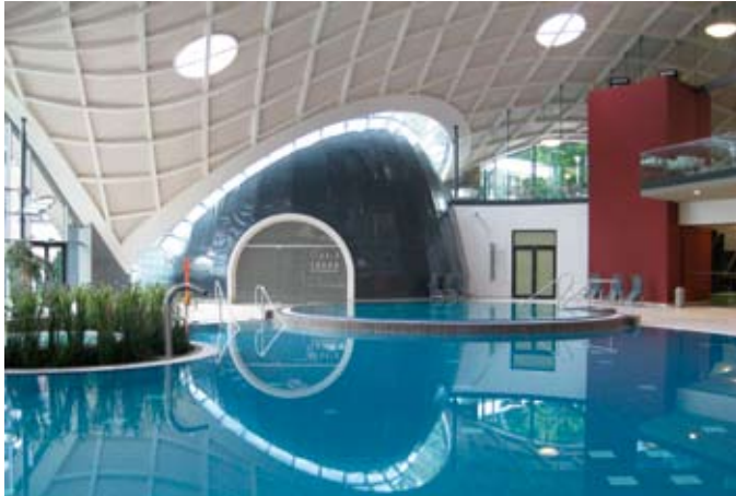
Die moderne Bäderanlage mit „Liquid-Sound“-Kuppel wartet architektonisch und technisch mit zahlreichen Neuerungen auf, beispielsweise mit Unterwasser-Lautsprechern und ausgeklügelter Lichttechnik