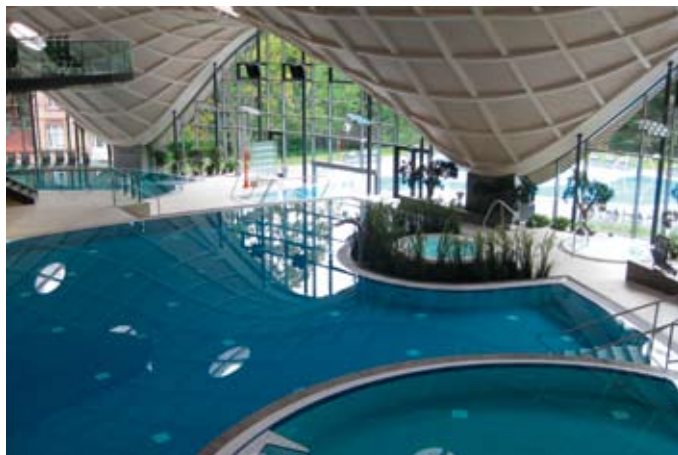
Keine gewöhnliche Badelandschaft, sondern eine Inspiration für die Sinne erwartet die Besucher in der Toskana Therme in Bad Orb