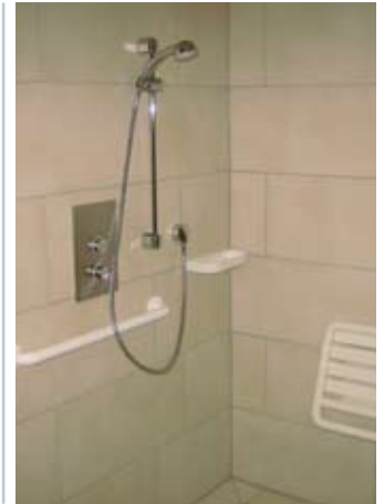
Aufgrund des leichtgängigen Betätigungskopfs können auch bewegungseingeschränkte Gäste die Duscharmatur „Linus SC“ gut bedienen

gienestandard bieten und gleichzeitig den sparsamen Umgang mit Wasser ohne Komfortverzicht gewährleisten. In der gesamten Anlage, in Innen- und Außenbereichen, kamen die Duscharmaturen „Linus SC“ mit Edelstahlfrontplatte, integriertem Thermostat und einer Heißwassersperre bei 38 °C zum Einsatz. Durch leichten Druck der Handfläche auf dem Armaturenknopf wird der Wasserlauf aktiviert und stoppt nach maximal 30 s automatisch. Drückt der Nutzer die Sperrtaste bei gleichzeitigem Drehen des Reglers, so kann er seine Wunschtemperatur höher oder niedriger wählen. Sicherheitsplus: Bei Kaltwasserausfall reagiert der thermostatische Verbrühschutz – eine Verriegelung sperrt den Heißwasserzulauf. Auch die Installation verlief reibungslos und zeitsparend, denn Basis der Duscharmaturen „Linus SC“ bilden die Schell-Masterboxen für den Wandeinbau, in denen die anspruchsvolle Technik schon fix und fertig implementiert ist.