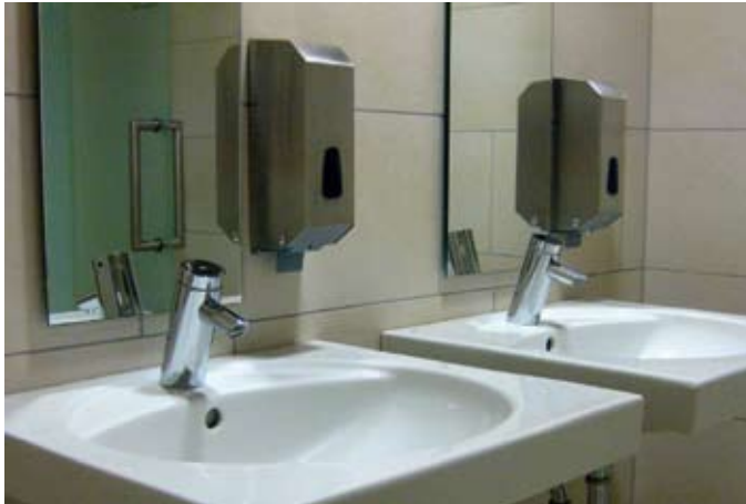
Optisch ansprechend, robust und wirtschaftlich: die Selbstschlussarmaturen „Puris SC“ von Schell