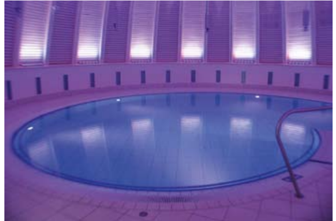
Pure Entspannung für Körper und Geist: Im besonders solehaltigen „Liquid sound“-Becken wird der Körper federleicht, die Besucher ruhen bis zu den Ohren in warmem Salzwasser und lauschen kristallklaren Klängen